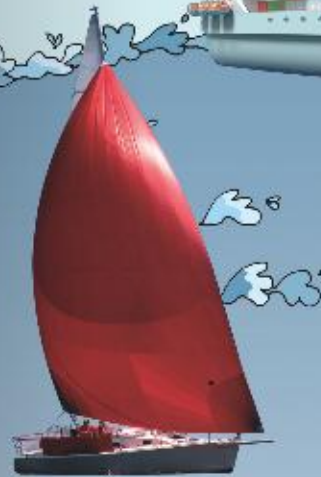
barco de vela