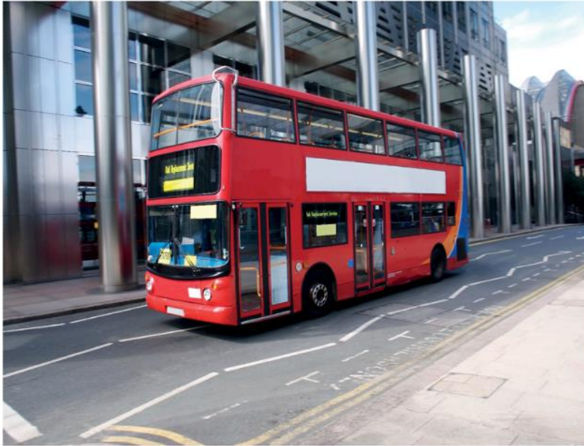
5 Autobús londinense

Aquí tenéis otra fotografía de un autobús londinense.